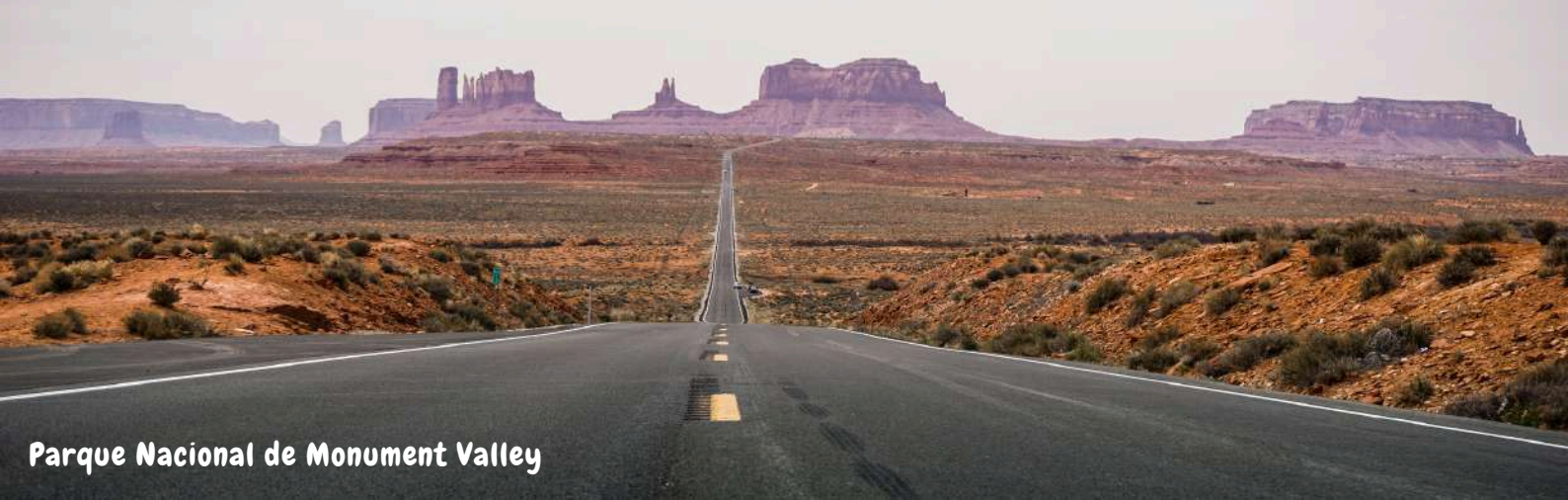
Parque Nacional de Monument Valley