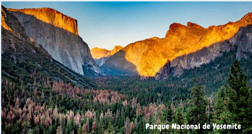
Parque Nacional de Yosemite