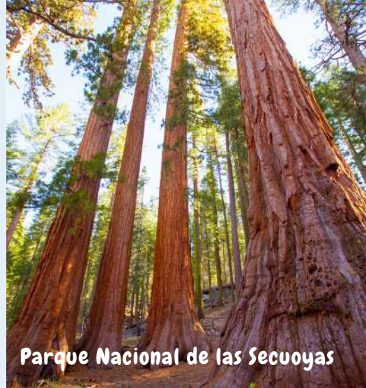
Parque Nacional de las Secuoyas