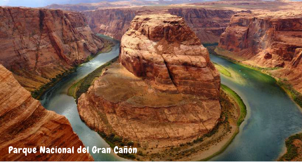
Parque Nacional del Gran Cañón